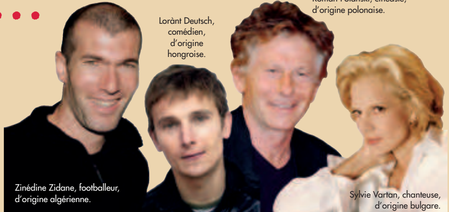
Zinedine Zidane, footballeur, d'origine algérienne.