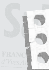
Tableau des contenus